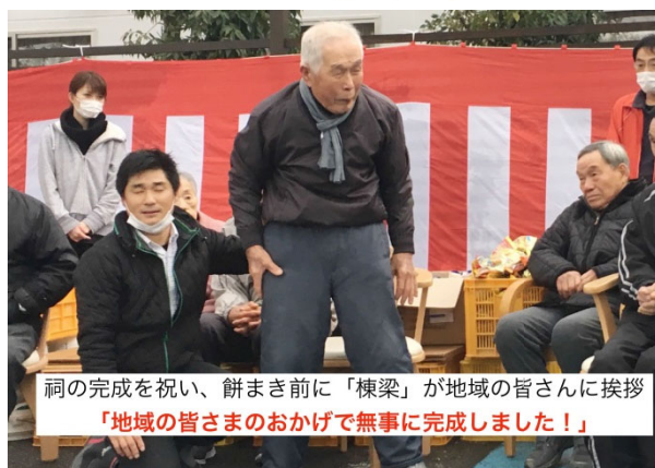
祠の完成を祝い、餅まき前に「棟梁」が地域の皆さんに挨拶 「地域の皆さまのおかげで無事に完成しました！」